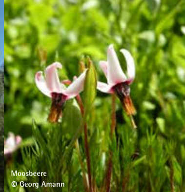
Moosbeere © Georg Amann