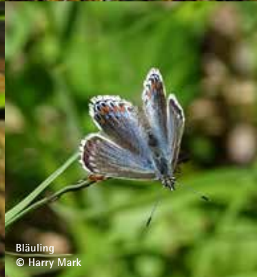
Bläuling